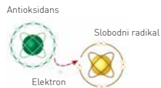
Slika br. 2

Antioksidansi neutrališu slobodne radikale predajući im jedan svoj elektron čime se zaustavlja lančana reakcija i degradacija ćelija. Prikaz predaje elektrona antioksidansa slobodnom radikal (slika br. 2).