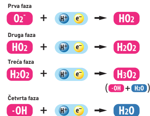
Slika br. 3

Prirodna veza vodonika i kiseonika kojom se stvara molekul vode čini da je vodonik najjači prirodni antioksidans koji jedini svodi štetne kiseoničke slobodne radikale na molekul vode prema sledećem prikazu (slika br. 3).